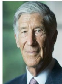
Joël de ROSNAY Prospectiviste